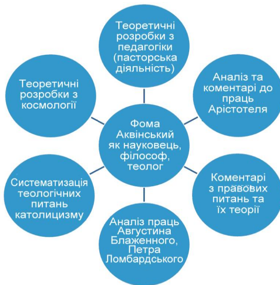
Схема 1. Концепція наукової діяльності Фоми Аквінського

Роль Фоми Аквінського в європейській історії можливо вважати прогресивною в плані примирення концептів – наука та релігія, діалектика та схоластика, логіка та божественне одкровення,