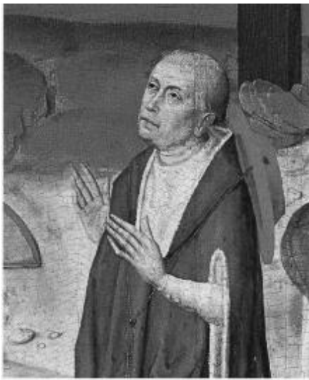
М. Кузанський (1401–1464)

зробимо зауваження. «Пантеїзм» – це поняття, що відображає єдність фізично-духовного, де завуальовує присутність трансцендентного, універсального в межах безпосереднього. Згідно з ним природа є не тому, що її створив Бог, а тому, що вона відтворює на всіх рівнях організації надчуттєвий принцип багатоманітності, невпорядкованості і унікальності. Бути існуючим означає містити у собі віддзеркалення незнищених смислів, закладених у кожній частині світобудови над раціональним – вічністю (eternitatis).